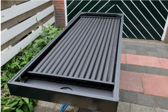
Figuur 3. Het paneel met omhulling echter nog zonder glas.