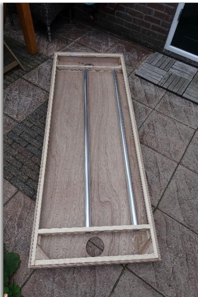
Figuur 2. Het paneel in aanbouw, nog ongeschilderd met slechts twee alu-buizen en zonder glas

Conclusie: het systeem werkt , maar in de winter schijnt de zon niet vaak genoeg om het effectief te kunnen gebruiken. Als de zon zich laat zien dan wordt mijn garage (atelier/werkplaats) een paar graden warmer.