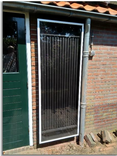
Figuur 1, het eindresultaat

Boven en onder is een kamer gecreëerd over de hele breedte van de bak van 15 cm hoog. De luchtinlaat en uitlaat zitten aan de achterkant (muur) en daarin zijn twee 10 cm doorvoeren naar binnen gemaakt. Aan de binnenkant van de garage staat een buisventilator (160m 3 /uur – 34 watt) dat aan de onderkant (binnen)lucht vanuit de garage in het paneel blaast, dat vervolgens door de inmiddels opgewarmde buizen aan de bovenkant weer in de garage wordt geblazen. De uitgaande lucht is ongeveer 20 C warmer is als de temperatuur bij de inlaat.